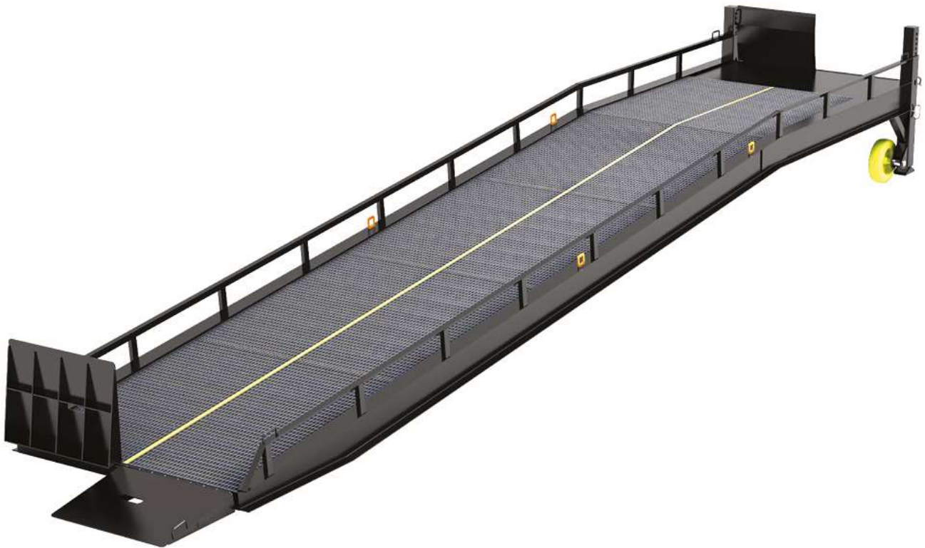
Рампа мобильная без опоры на кузов автомобиля

Мобильные ramпы DoorHan предназначены для обеспечения доступа автопогрузчика с поверхности земли в кузов автомобиля. Они не требуют специальной подготовки для запуска, позволяя проводить погрузочно-разгрузочные работы, не прибегая к строительству стационарной ramпы. Все ramпы имеют схожий принцип работы. Ramпа поднимается при помощи механического или гидравлического привода, оборудованного системой безопасности, и перемещается погрузчиком к автомобилю. Ramпа с опорой на кузов автомобиля ложится на кузов, ramпа с собственными опорами устанавливается на опоры. После окончания работ ramпа поднимается и с помощью погрузчика транспортируется к месту хранения.