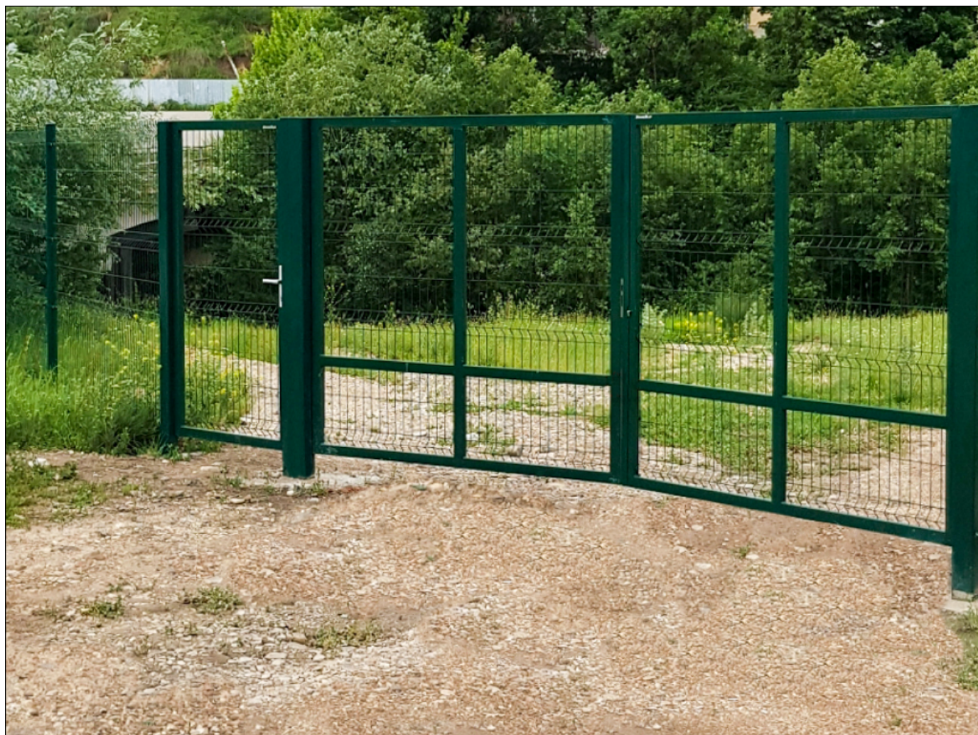
Системы ограждений с калиткой и распашными воротами