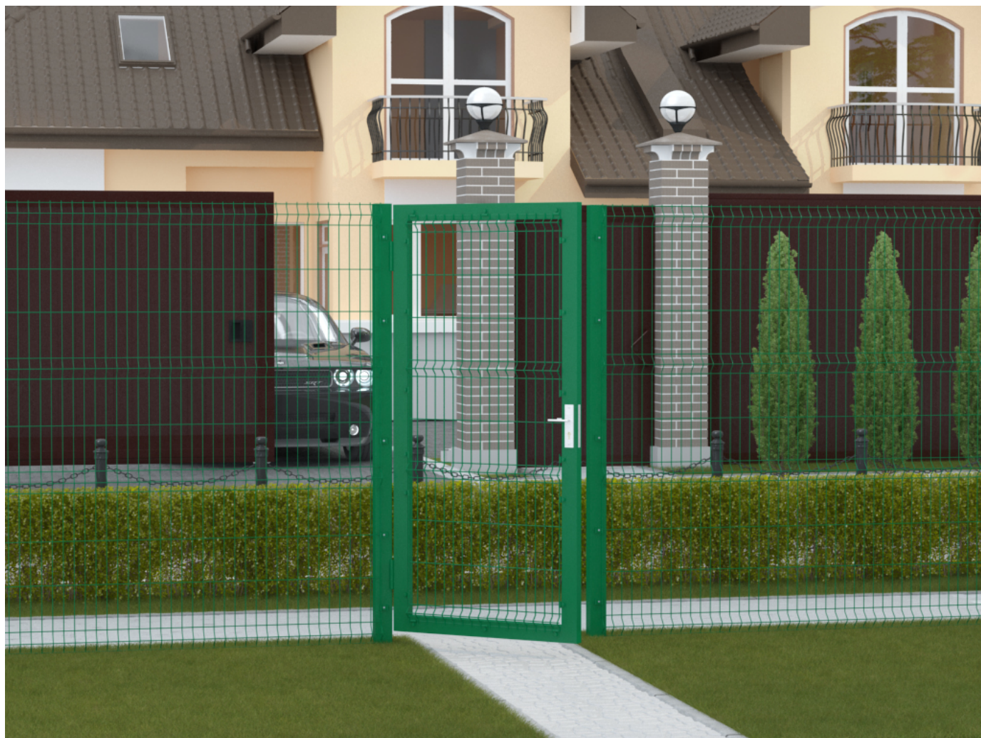
Внешний вид калитки со стальной рамой и заполнением сетчатой панелью

Калитки обеспечивают комплексный подход к защите объекта и удобный доступ на огражденную территорию. Подходят как для загородного дома, так и для объектов промышленного назначения. Полотно изготавливается из тех же металлических секций, что и системы ограждений.