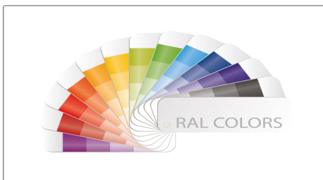
Нестандартный цвет по карте RAL (наценка)