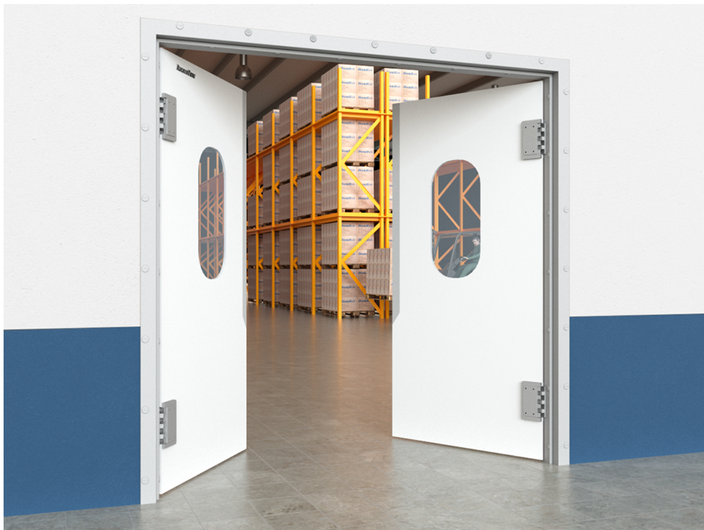
Пластиковые маятниковые двери SWD

Распашные маятниковые двери из высокомолекулярного полиэтилена предназначены для установки на объектах промышленного, складского, торгового и другого назначения. Конструкция ворот позволяет им возвращаться в исходное положение и автоматически смыкаться сразу после прохода сквозь них. Ворота отличаются бесшумной работой и легкостью функционирования.