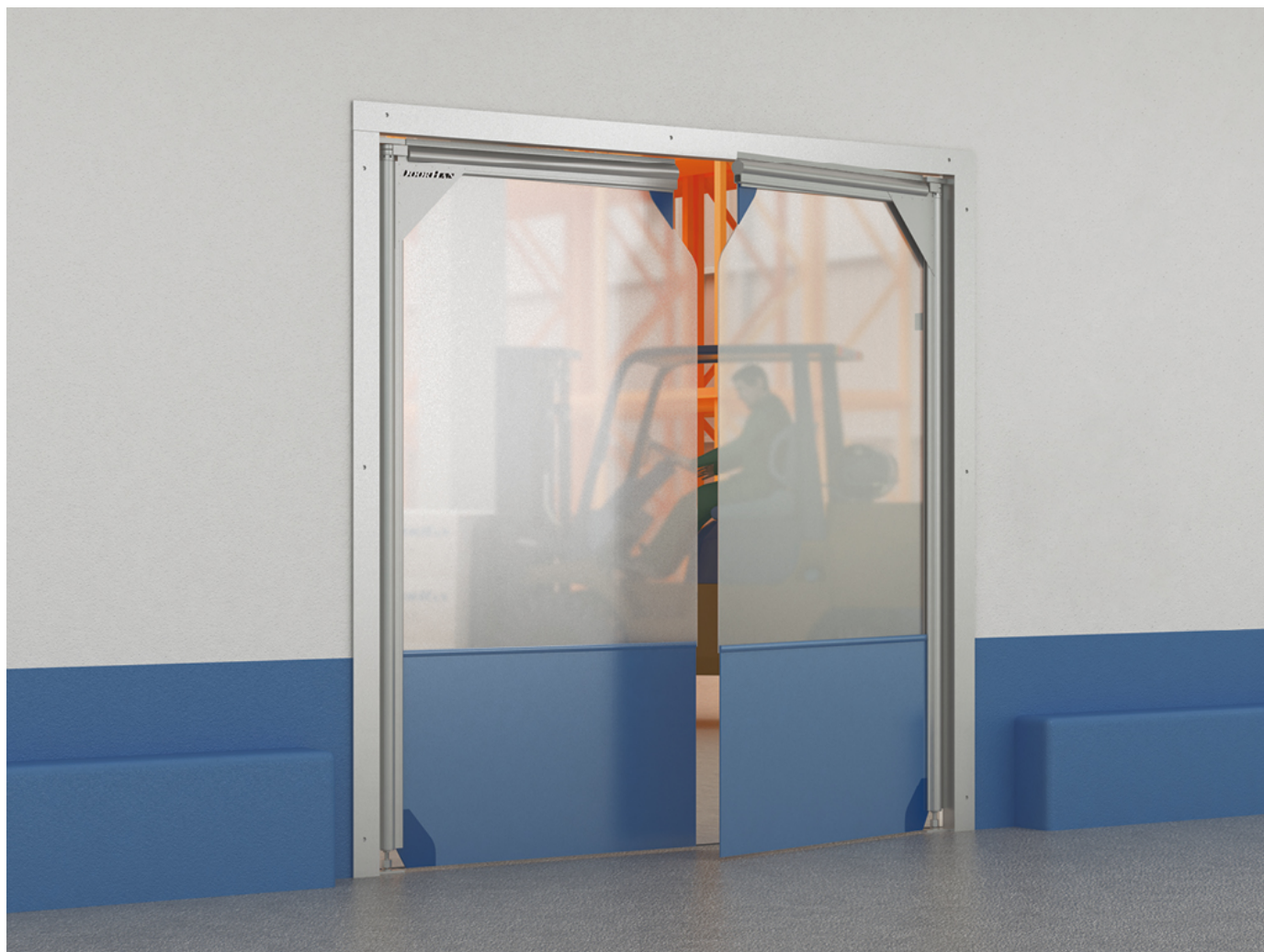
Распашные пленочные ворота

Распашные пленочные ворота ПВХ предназначены для изоляции и сохранения микроклимата помещений на объектах промышленного, складского, торгового и другого назначения. Конструкция ворот позволяет им возвращаться в исходное положение и автоматически смыкаться сразу после прохода сквозь них. Ворота отличаются бесшумной работой, простотой эксплуатации и быстрой очисткой.