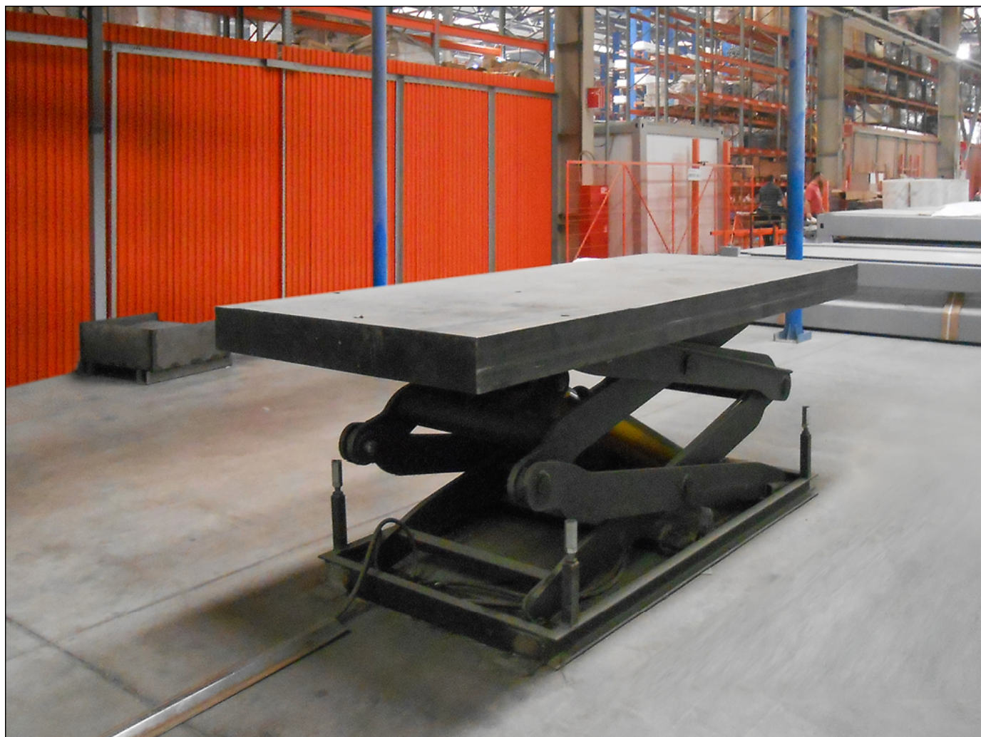
Подъемный стол с двумя парами ножниц