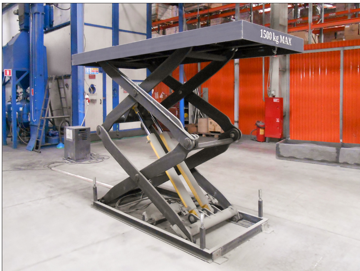
Подъемный стол с двумя парами ножниц